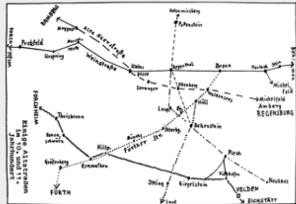
Foto: © Melanie Schulz – Stadlmetzhaus Benzensteiner historischer Veröffentlichung

Anmeldung: bitte bis 27.12.2024 direkt bei Melanie Schulz unter 09244 982944